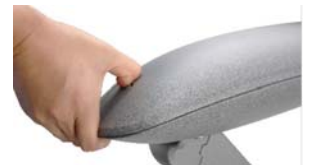
Apertura sin herramientas