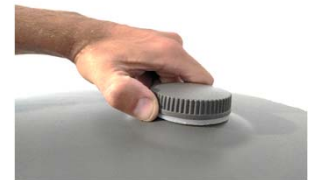
Apertura sin herramientas