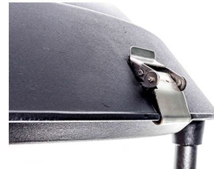
Detalles de Cierre: Versión MINI