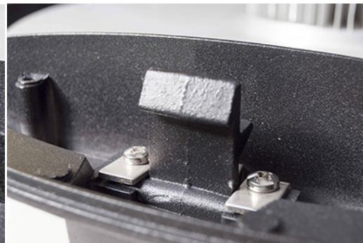
Detalles de Cierre: Versión MAXI