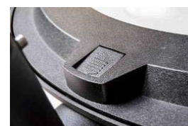
Apertura sin herramientas