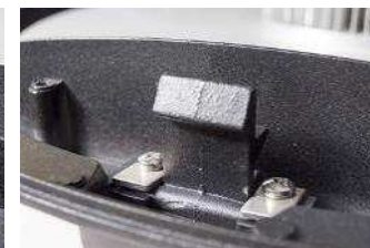
Detalles: cierre de la tapa.